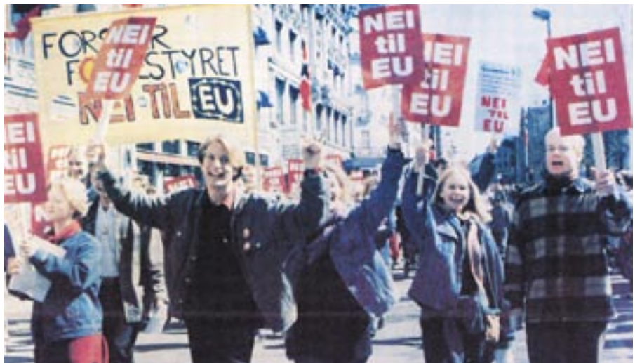
1994. Demokrati var hovedgrunnen til at flertallet stemte nei i den norske EU-avstemningen.

Greenpeace har protestert til EUs ombudsmann om ureddelig lobbyisme i EU-kommisjonen under utformingen av kjemireformen Reach. Problemet er at byråkrater som har arbeidet med reglene slutter og blir lobbyister for kjemiindustrien, uten at EU griper inn. Ett eksempel er franske Jean-Paul Mingasson, som etter 20 år i kommisjonen ble rådgiver for industriorganisasjonen Unice. (Kilde: Jyllandsposten 8. mai 2006)