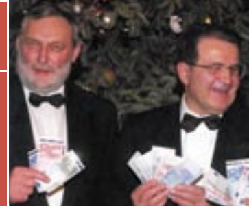
Kortglede. EUs felles mynt, euro, har ikke gitt det økonomiske oppsvinget EU-myndighetene håpet på.

Krona er ikke bare en mynt, det er også et økonomisk og politisk styringsredskap. Flere av Norges naboland og handelspartnere har sagt nei til ØMU; Danmark, Sverige og Storbritannia står utenfor denne delen av EU. Blir Norge EU-medlem, sier vi derimot ja til hele EU - inkludert ØMU og euro.